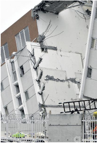
Volcamiento. Destrucción total de un edificio chileno.

En este sentido, la fotografía se presenta como un medio auxiliar muy válido.