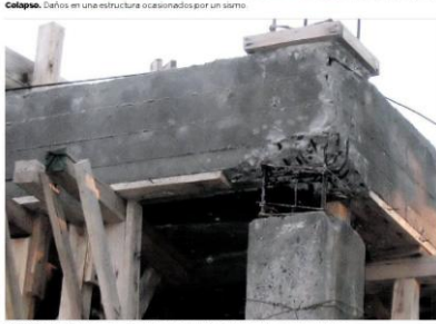
Colapso. Daños en una estructura ocasionados por un sismo.

Una solución absolutamente novedosa y a su vez exitosa fue la adoptada por F. L. Wright cuando montó el hotel imperial de Tokio sobre una cuña articulada a la manera de una rótula.